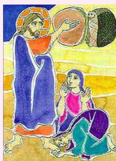
La risurrezione di Lazzaro.

17.00 Vespri solenni e Adorazione eucaristica.